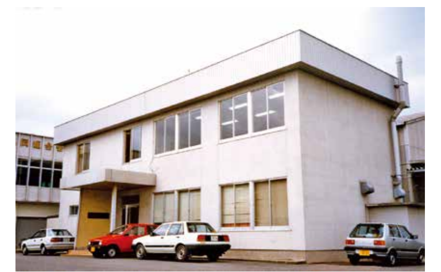
1977年: 設立許可届と当時の協会庁舎