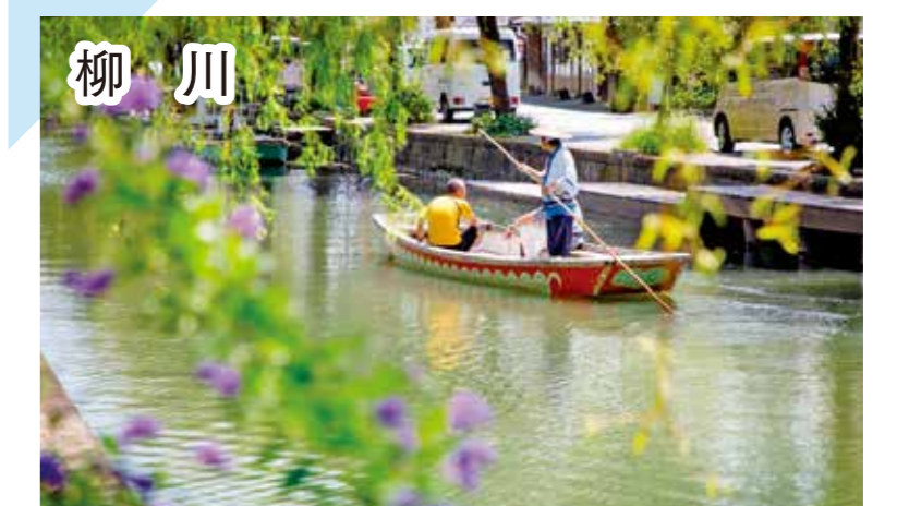
風景写真提供：福岡県観光連盟